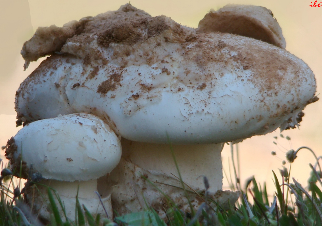
Amanita ponderosa (Gurumelo)